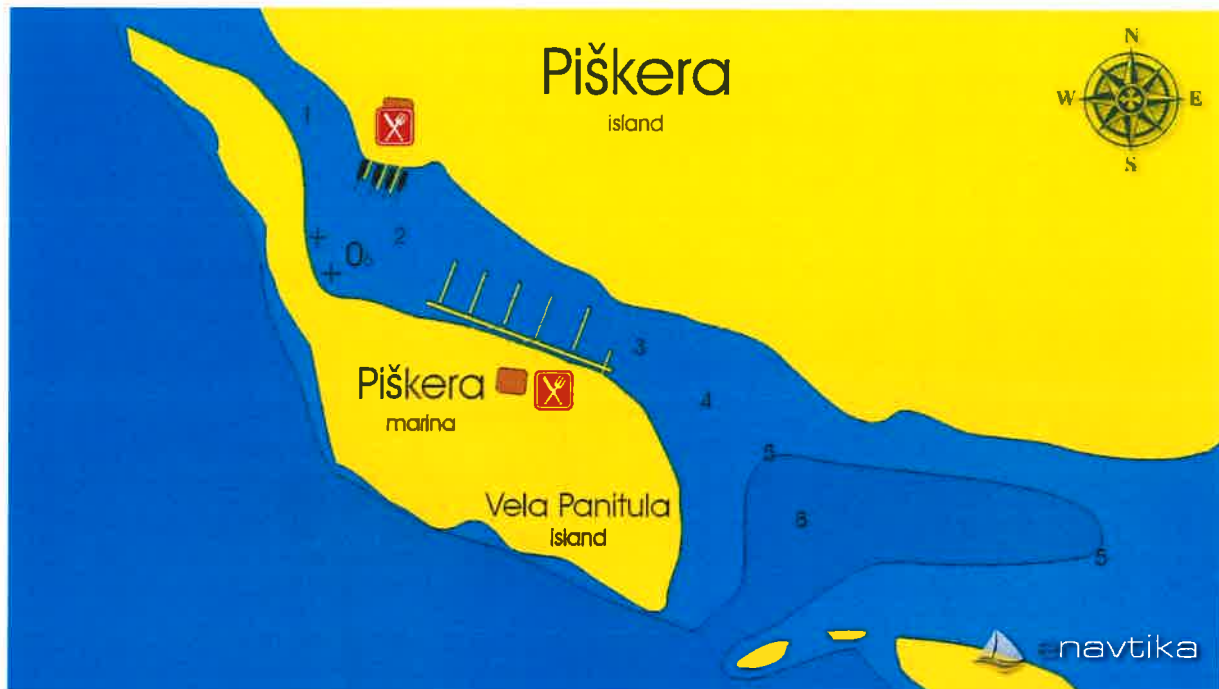
Prilog 1a. Isječak pomorske karte s prilaznim plovnim putem